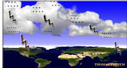
Gambar 1. Pemisahan muatan positif dan negatif dalam awan cumulonimbus

yang lebih ringan bertumbukan dengan butiran-bitiran es yang lebih berat di dalam awan. Kristal yang lebih ringan membentuk muatan positif dan bergerak ke bagian atas awan sedangkan butiran-butiran es yang berat bermuatan negatif dan bergerak ke bagian bawah awan seperti pada Gambar 1.